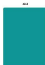
โรงพยาบาลสุราษฎร์ธานี